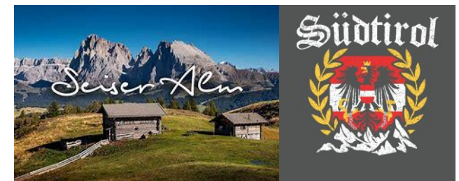
Meran – Kloster Neustift - Felsenkeller Laimburg - Seiser Alm - Ritten

Organisation und Planung: Gerd Loacker, Vereinsleitung und Monika Entlicher (Loacker Tours) Foldergestaltung, Idee und Druck: Bruno Fleisch