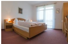
Zimmer Hotel Elefant