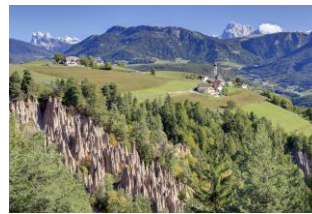
Erdpyramiden von Ritten

Die Erdpyramiden am Ritten sind nicht nur ein Naturwunder, sondern lassen sich auch mit einer wunderschönen Wanderung kombinieren. Kinder bezeichnen sie als Lehmssäulen mit Hut. Eines haben alle gemeinsam: Sie sind zu jeder Jahreszeit einen Ausflug wert.