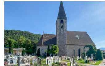
St. Peterskirche in Auer

St. Peterskirche in Auer. Am südlichen Dorfeingang von Auer, umgeben vom örtlichen Friedhof, befindet sich die im 11. Jahrhundert erbaute gotische Kirche. Sie war in vergangener Zeit die wichtigste Kirche der umliegenden Dörfer. Die ursprüngliche Pfarrkirche der Gemeinde liegt in einer ca. 5 m tiefen Grube, die wegen Überschwemmungen des naheliegenden Schwarzenbachs öfters nicht zugänglich war. Erst viel später wurde die Kirche freigelegt und durch eine Schutzmauer geschützt. Die Kirche ist heute, nach Restaurierungsarbeiten in den 70er Jahren, für den Besuch der heiligen Messen und Feierlichkeiten öffentlich zugänglich und beherbergt die älteste noch bespielbare Orgel Südtirols. Sie wurde um 1600 vom Orgelbauer Hans Schwarzenbach gefertigt.